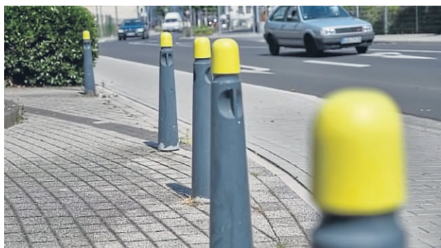
Wahrnehmbar für viele Sehbehinderte: der gelbe Kopf am grauen Poller, gesehen am Platz vor der Steinheimer Straße 1.

Büro übernimmt, sei es dennoch wichtig, dass die Bezirksgruppe Hanau des Blinden- und Sehbehindertenbundes viele Mitglieder hat, für den gegenseitigen Austausch, für Selbsthilfegruppen und für gemeinsame Freizeitaktivitäten bis hin zu Reisen. Aktuell sind es rund 180 Personen, Tendenz schwindend. „Die Älteren sterben uns weg und neue Mitgliedschaften ergeben sich oft nur beim persönlichen Beratungsgespräch.“ Wegen der Corona-Auflagen hätten die bis vor Monaten lediglich über Telefon erfolgen können, sagt Schäfer, die auch Vorsitzende der Bezirksgruppe ist.